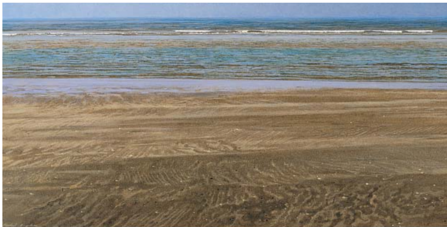
Fig. 170. INTERVALLES, 2002, 20 x 40 cm, acryl op paneel