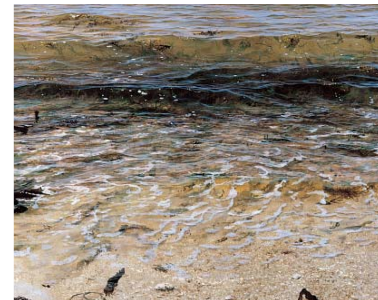
Fig. 172. ZIG ZAG VAGUES, 2003, 20 x 20 cm, acryl op paneel